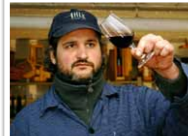
Die Weine der Region sind im Kommen

Kraichgau? Aber ja! Also nix wie hin in die „Krone“ (Neueröffnung 6/08) und aufs Neue erfahren, welch positive Eigenschaften gute Kräuterküche zu entfalten vermag. Gute Laune zum Beispiel. Und Abenteuerlust! Wir entscheiden uns also, ein wenig zu verlängern und übernachten in Maulbronn, im Gästehaus der Klosterschmiede. Dortselbst widmen wir uns einen Abend lang den Weinen des Herzogs von